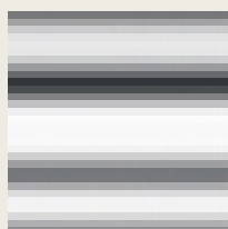
chrome (+ 14,76 zł)